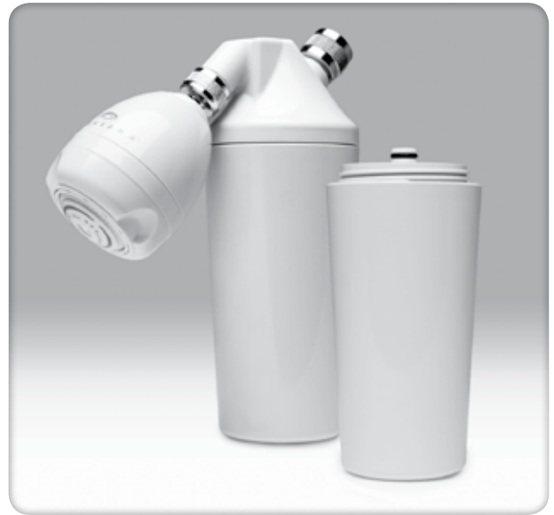
Modelo # AQ-4125